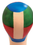
ミッドセクション